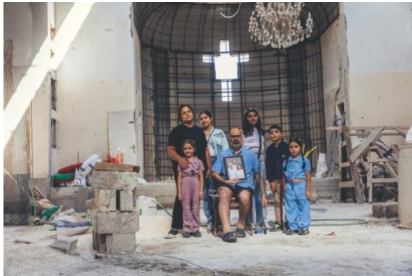
敘利亞弟兄以利亞和家人在聖以利亞教堂